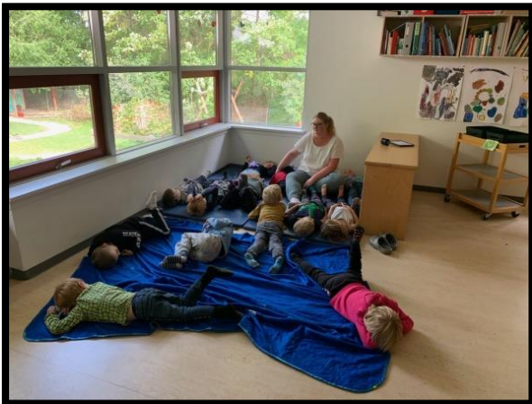
En SFO-voksen holder samling i børnehaven.

I løbet af efteråret kommer der en SFO personale på besøg en formiddag i storgruppen. Storgruppens pædagog tager på besøg i skolen, dette for at få større indsigt i hinandens arbejdsområder.