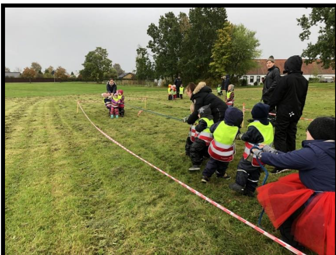
Forældre hjælper til på den fælles motionsdag.